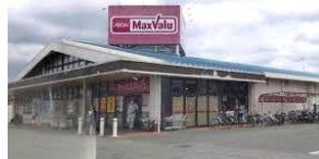
マックスバリュ平川店 徒歩 約5分