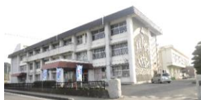
平川小学校・中学校 徒歩 約9分