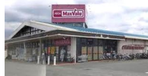
マックスバリュ平川店 徒歩 約5分