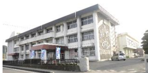
平川小学校・中学校 徒歩 約9分